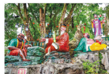
八仙神像（蜈蚣山天师宫）