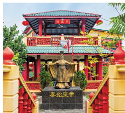
秦始皇铜像（九龙宫）